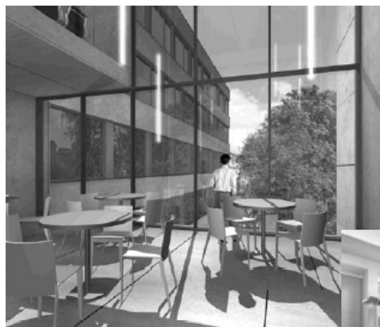
Aufenthaltsraum im Zwischentrackt