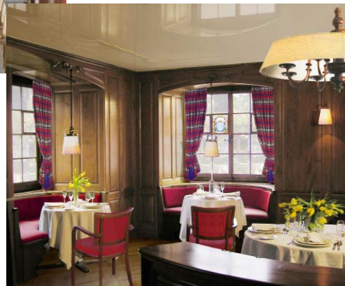
Restaurant mit 35 Plätzen