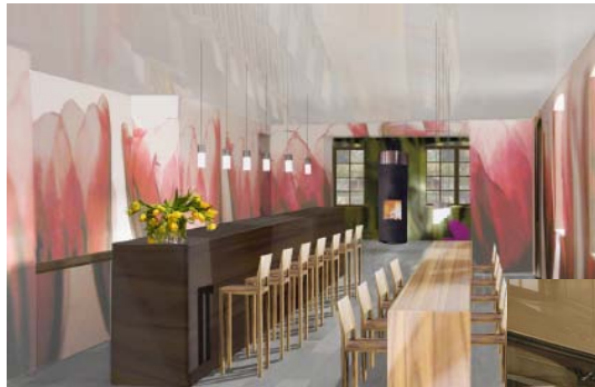
Cafe-Bar mit ca. 35 Plätzen

Bauherrschaft: Stadt Dietikon Bregartenstrasse 22 8953 Dietikon Baumanagement: Staub AG, Baumanagement Architektur: Tilla Theus und Partner AG Bionstrasse 18 8006 Zürich